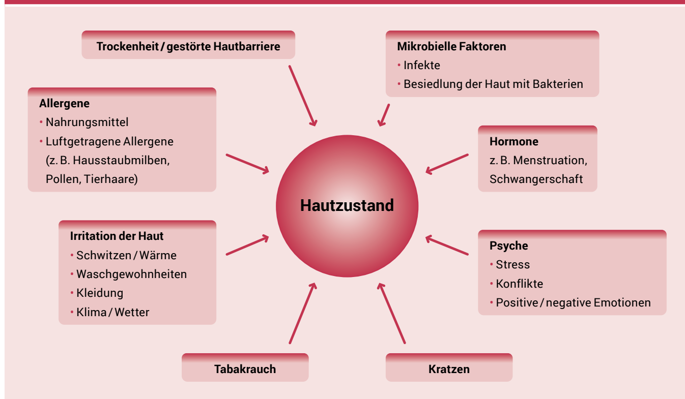
Abbildung 1. Auslöser (Triggerfaktoren) bei Neurodermitis

werden, wird bei gesunder Haut der Zusammenhalt der Zellen an der Hautoberfläche durch Lipide (Fette) bewerkstelligt (Abb. 2, linke Bildhälfte). Man spricht dann von einer intakten Hautbarriere, welche die Haut vor äußeren Reizen sowie vor Wasserverlust, also Austrocknung, schützt. Fehlen funktionstüchtige Lipide, dann wird der Zusammenhalt der Hautzellen und damit die Schutzfunktion der Haut gestört. Allergieauslöser können in die Haut eindringen und Wasser geht nach außen verloren, die Haut wird zu trocken (Abb. 2, rechte Bildhälfte). Zusätzlich kann durch Entzündungsstoffe, welche z. B. nach Kontakt mit einem Allergieauslöser gebildet werden, und andere äußere Reizungen die Hautbarriere beeinträchtigt werden. Die Störung der Hautbarriere ist nach heutigem Wissen die entscheidende, grundlegende Störung bei der Neurodermitis.