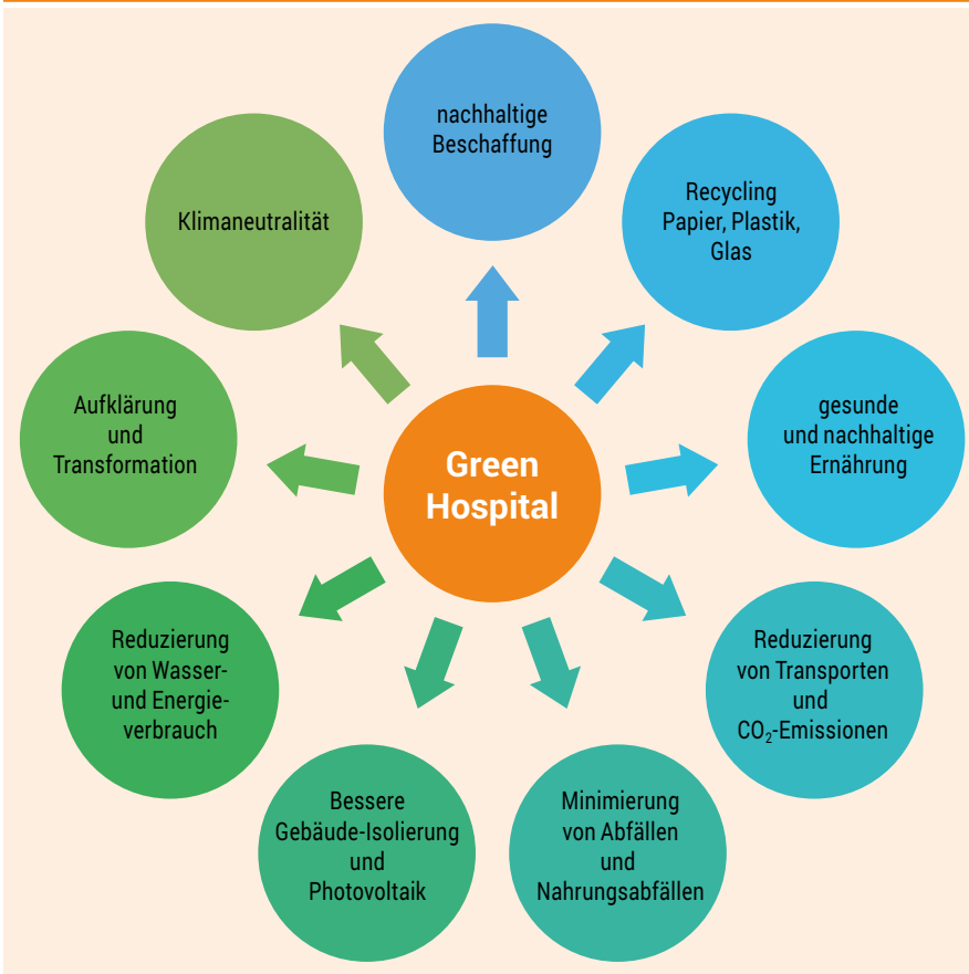
Abbildung 2. Die verschiedenen Aktionspfeiler eines nachhaltigen Krankenhauses