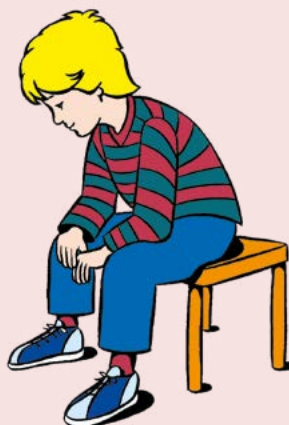
Abbildung 3. Kutschersitz