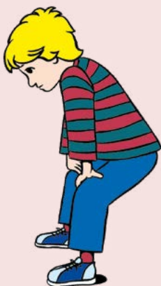
Abbildung 2. Torwartstellung

rasch in ein kleines Gerät aus; dadurch lässt sich erkennen, ob die Bronchien verengt sind oder nicht. Eventuell wird die Ärztin bzw. der Arzt für Kinder- und Jugendmedizin vor dem Sport z. B. die Inhalation eines Beta-Mimetikums empfehlen; dies kann über mehrere Stun-