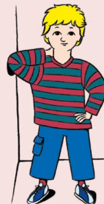
Abbildung 4. Joe Cool