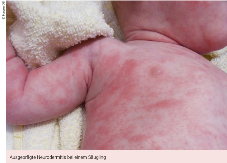
Ausgeprägte Neurodermitis bei einem Säugling

Die Neurodermitis ist eine starkjuckende, in der Regel chronische und in Schüben