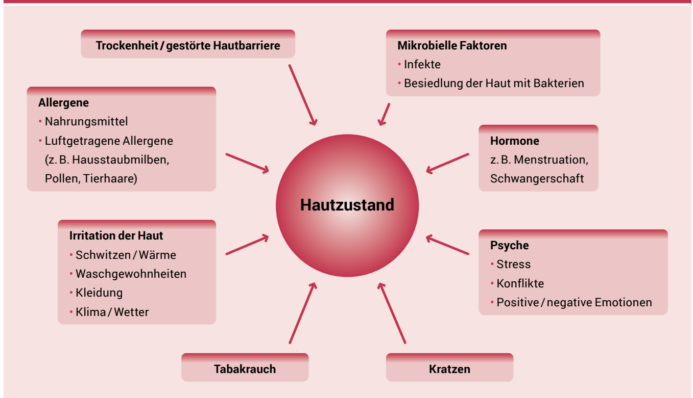
Abbildung 1. Auslöser (Triggerfaktoren) bei Neurodermitis

werden, wird bei gesunder Haut der Zusammenhalt der Zellen an der Hautoberfläche durch Lipide (Fette) bewerkstelligt (Abb. 2, linke Bildhälfte). Man spricht dann von einer intakten Hautbarriere, welche die Haut vor äußeren Reizen sowie vor Wasserverlust, also Austrocknung, schützt. Fehlen funktionstüchtige Lipide, dann wird der Zusammenhalt der Hautzellen und damit die Schutzfunktion der Haut gestört. Allergieauslöser können in die Haut eindringen und Wasser geht nach außen verloren, die Haut wird zu trocken (Abb. 2, rechte Bildhälfte). Zusätzlich kann durch Entzündungsstoffe, welche z. B. nach Kontakt mit einem Allergieauslöser gebildet werden, und andere äußere Reizungen die Hautbarriere beeinträchtigt werden. Die Störung der Hautbarriere ist nach heutigem Wissen die entscheidende, grundlegende Störung bei der Neurodermitis.