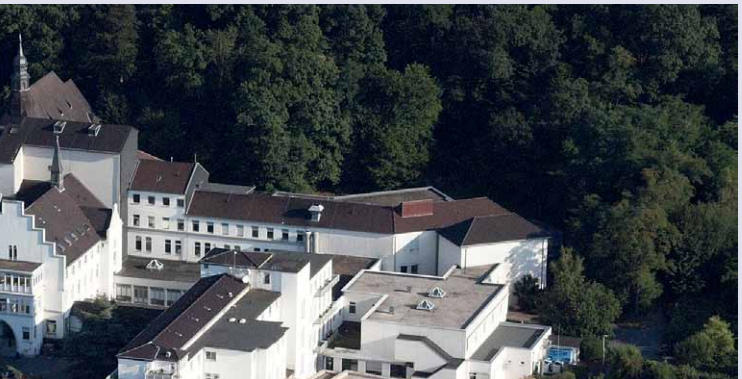
Abb.: St.-Marien-Hospital Bonn